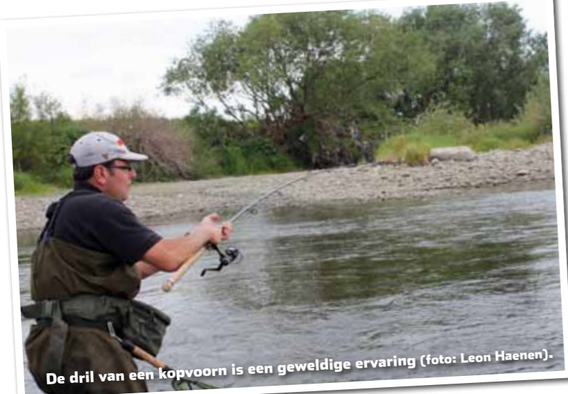
De drill van een kopvoorn is een geweldige ervaring.