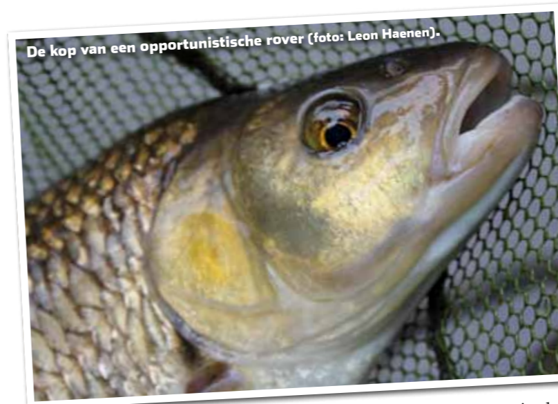
De kop van een opportunistische rover (foto: Leon Haenen).

puur gebaseerd op zijn observaties langs de rivier. Het lijkt hem een goed idee dat de federatie de afname van deze unieke inheemse vis gaat onderzoeken. Wellicht zijn er dan maatregelen mogelijk die de Grensmaaspopulatie beter beschermen.