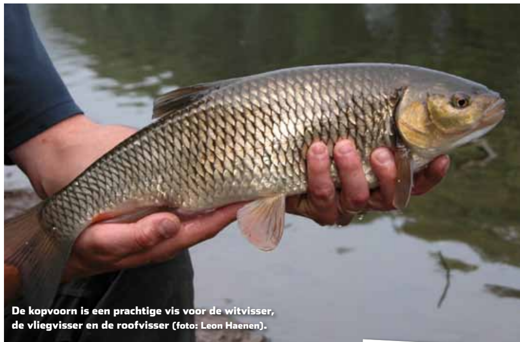
De kopvoorn is een prachtige vis voor de witvisser, de vliegvisser en de roofvisser.