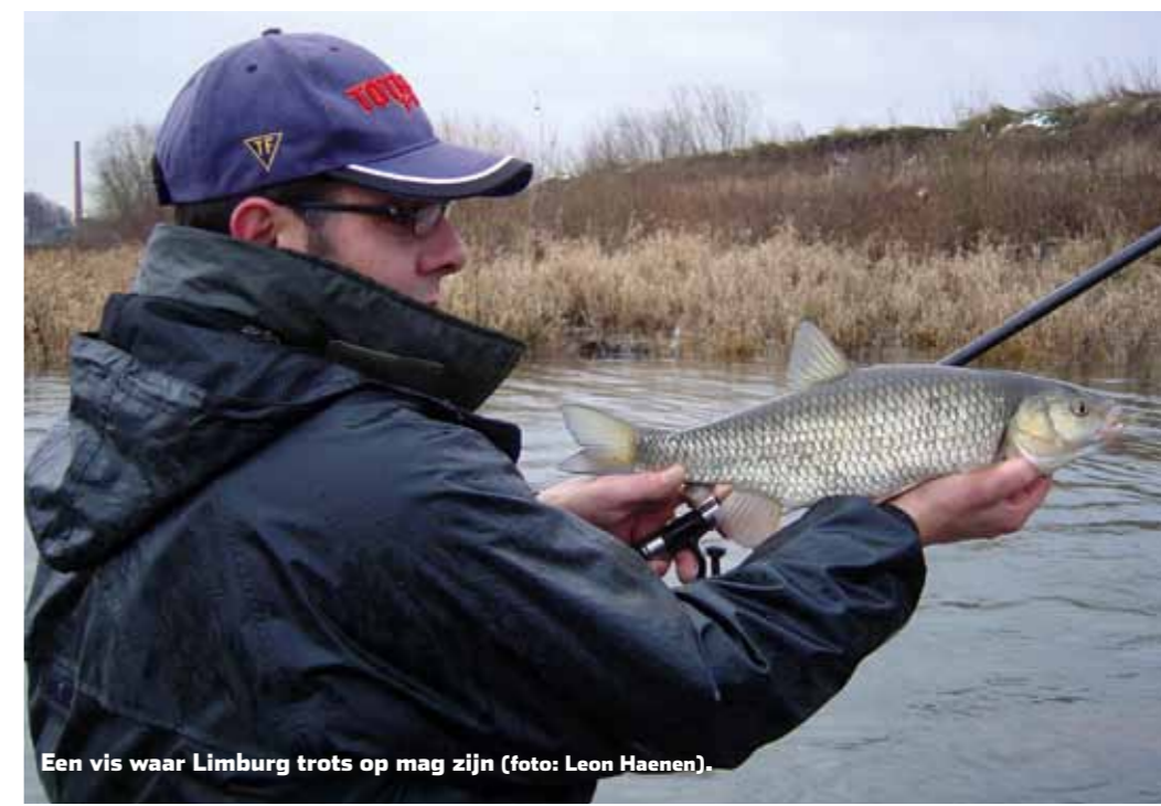
Een vis waar Limburg trots op mag zijn.