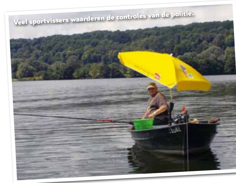
Veel sportvissers waarderen de controles van de politie.