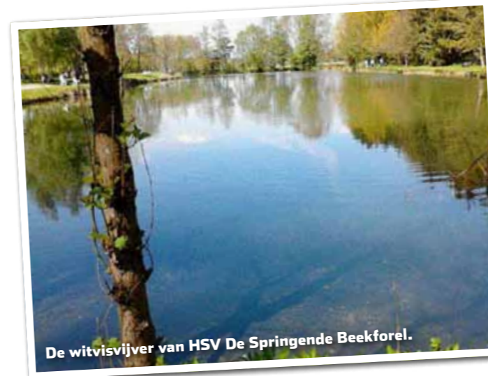
De witvisvijver van HSV De Springende Beekforel.

Een fantastisch resultaat! Voor de meeste andere hengelsportverenigingen biedt dit uitzetbeleid helaas geen oplossing voor de aalscholverproblematiek. Dit omdat ze te veel moeten investeren vanwege de grootte van de vijver in relatie tot de uitzet van het aantal kilo karper.