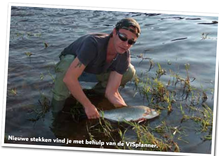
Nieuwe stekken vind je met behulp van de VISplanner.

geven dat je ergens mag vissen, is dit geen garantie dat je de oever ook makkelijk kunt bereiken. Vooral langs de Maas, sommige kanalen en nabij recreatieterreinen zijn de oevers, vaak als gevolg van natuurontwikkelingsprojecten, niet (meer) gemakkelijk bereikbaar per auto. Daar zul je na de auto te hebben geparkeerd een stukje moeten lopen om bij de stek te komen. De vermelding in de VISplanner geeft geen rechtvaardiging om de toegang van de oever per auto af te dwingen.