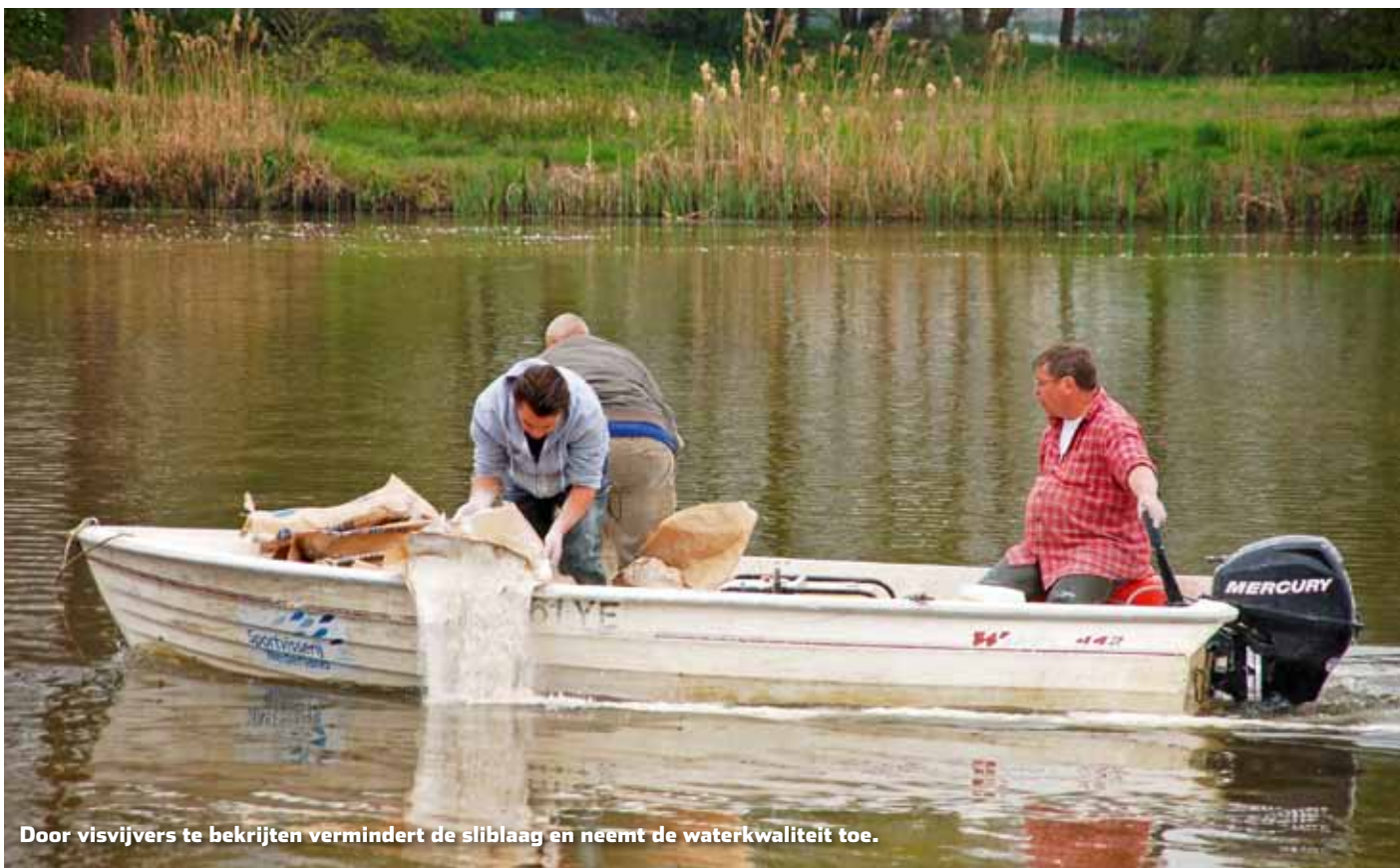
Door visvijvers te bekrijten vermindert de sliblaag en neemt de waterkwaliteit toe.

Hengelsportvereniging De Wiejert uit Limbricht is in april 2011 gestart met het bekrijten van de dikke, slappe baggerlaag in hun viswater dat deel uitmaakt van de Kasteelvijver in Limbricht. Het project dat is gestart als een leerproject om een sliblaag te reduceren, loopt nu bijna vier jaar. Tijd om de ervaringen van de vereniging op te tekenen.