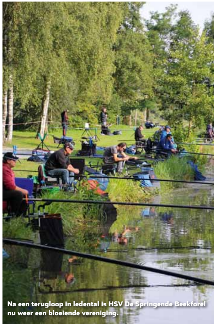
Na een terugloop in ledental is HSV De Springende Beekforel nu weer een bloeiende vereniging.

HSV De Springende Beekforel in Wijre kreeg de afgelopen jaren frequent bezoek van de aalscholver, waardoor de visstand en het ledenaantal sterk afnam. De vereniging besloot niet bij de pakken neer te zitten en wist met succes het roer om te gooien. Tijd om deze innovatieve vereniging eens in de picture te zetten.