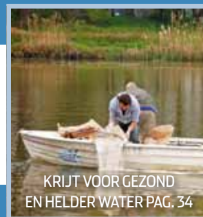
KRIJGT VOOR GEZOND EN HELDER WATER PAG. 34