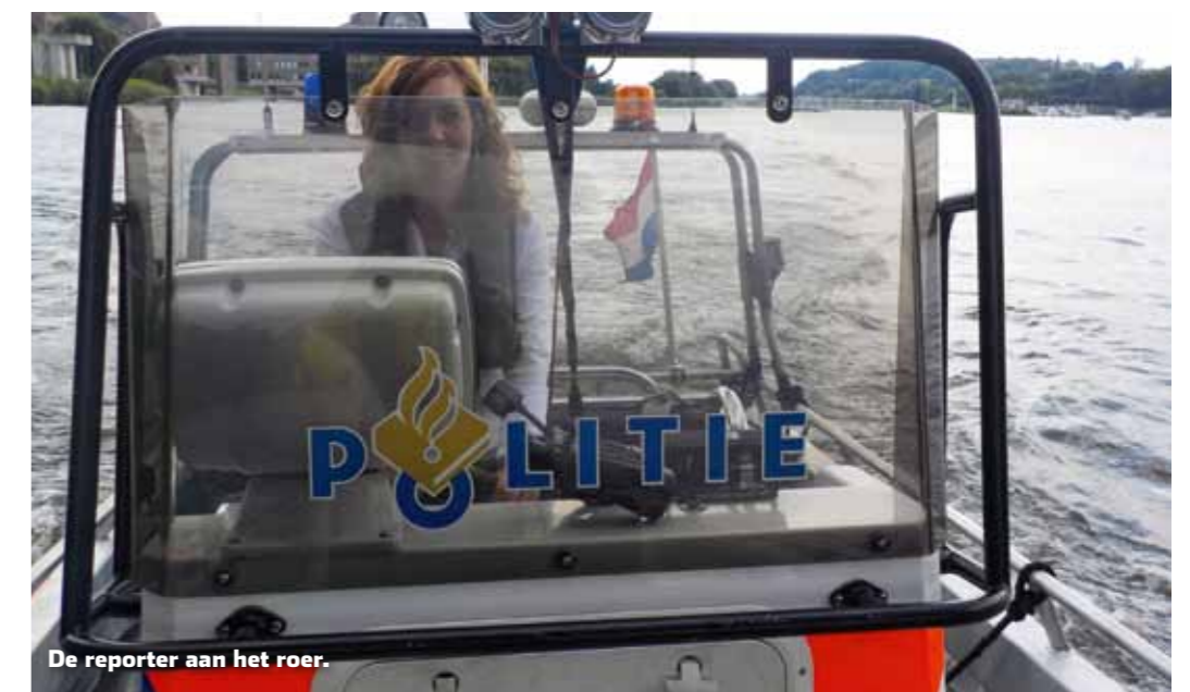
De reporter aan het roer.

Op de terugweg overvalt Frans me met de vraag of ik geen zin heb om ook nog een stukje te varen. Daar zeg ik natuurlijk geen nee tegen. Wat een kick om een politieboot te besturen! Vervolgens is het helaas al snel weer tijd om terug te keren naar Jachthaven Pietersplas. Onze controletocht zit erop. Wat een fantastische ervaring!