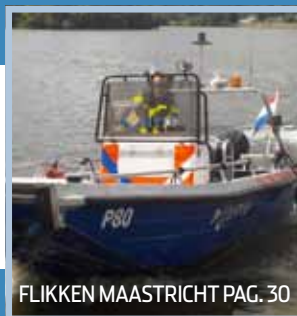
FLIKKEN MAASTRICHT PAG. 30