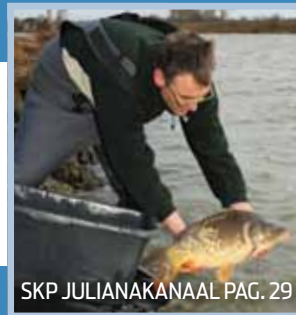
SKP JULIANAKANAAL PAG. 29