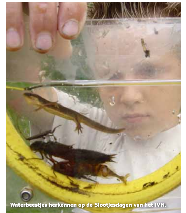
Waterbeestjes herkennen op de Slootjesdagen van het IVN.

Op www.scharrelkids.nl vind je heel veel leuke weetjes, tips, doe-ideeën en activiteiten die door het hele land worden georganiseerd. Op de website kun je ook een herkenningskaart 'Waterdiertjes' bestellen, waarmee je de meest diertjes in de Limburgse beekjes en plassen kunt herkennen.