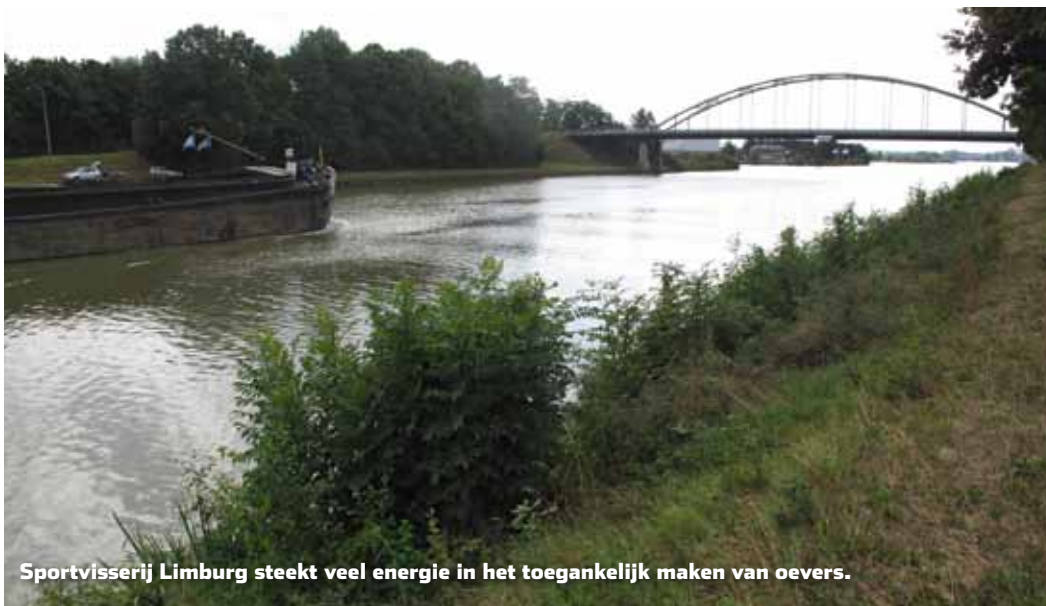
Sportvisserij Limburg steekt veel energie in het toegankelijk maken van oevers.

Het rapport 'Oplossingen voor sportvisserijknelpunten in de Grensmaas, Maas en Maasplassen' van Sportvisserij Limburg is eind vorig jaar aangeboden aan gedeputeerde Twan Beurskens. Hierin worden mogelijke oplossingen aangedragen om de toegankelijkheid van visoevers te verbeteren.