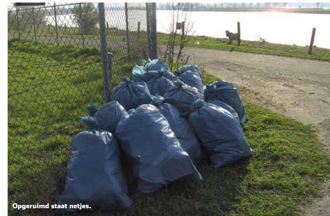
Opruimd staat netjes.

30.000 sportvissers kunnen een groot verschil maken bij het opruimen van klein afval. Veel sportvissers hebben al een afvalzak mee om hun stek schoon te houden. Aan andere sportvissers die dit nog niet doen de dringende oproep om je afval op te ruimen en ook het afval mee te nemen dat al op de stek lag om het vervolgens thuis in de vuilcontainer te gooien. Zo draagt de sportvisserij actief bij aan het schoonhouden van de visoever. Door onregelmatigheden te melden, je eigen afval en eventueel het afval op je visplek mee naar huis te nemen, draag je een steentje bij aan het oplossen van het zwerfvuilprobleem. Met zijn dertigduizenden kunnen we zo zeker een verschil maken.