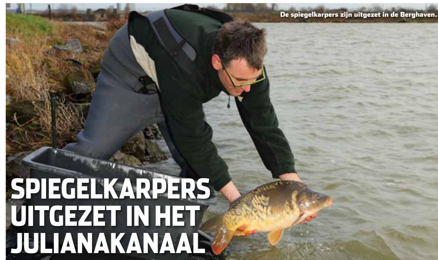
De spiegelkarpers zijn uitgezet in de Berghaven.

Een ambitie van de werkgroep is om de karperspopulaties in de Limburgse federatieve wateren op peil te houden of te brengen. Hiervoor is veel kennis nodig over de huidige populatie. Met monitoren vergaart de werkgroep die kennis. Het is dan echter van belang dat de oude en nieuwe populaties worden gevolgd en onderhouden door middel van nieuwe karpersprojecten en -uitzettingen. Om een goed beeld te kunnen vormen van de aanwezige populatie op het Julianakanaal en de overige federatieve wateren, heeft de werkgroep vangstgegevens nodig. Daar hebben zij de hulp van karpervissers in Limburg voor nodig. Deel daarom jullie vangstgegevens met de werkgroep. Mail bij het vangen van een karper de datum, het gewicht, de lengte, het water waar de vis is gevangen en een foto van beide flanken naar: deksnregiolimburg@gmail.com . De werkgroep gaat vertrouwelijk met de gegevens om en gebruikt ze enkel voor registratiedoeleinden en herkenning.