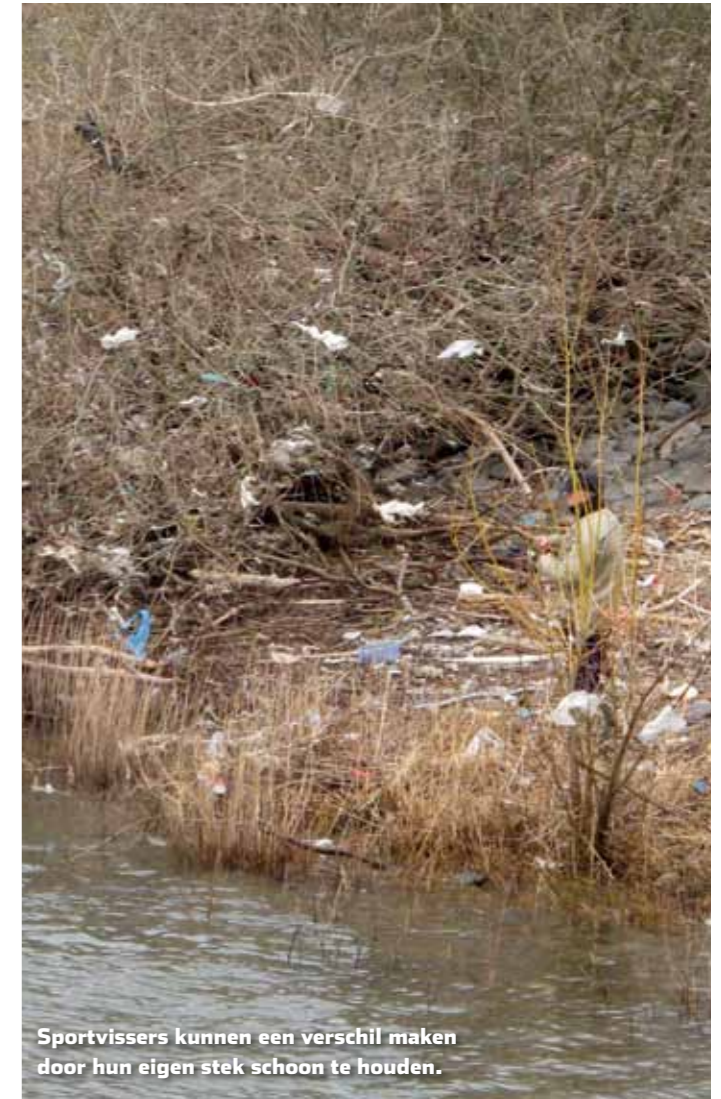
Sportvissers kunnen een verschil maken door hun eigen stek schoon te houden.

Sportvissers vertoeven vaak in deze natuurgebieden en zijn daar 'ogen en oren' van de beheerende natuurorganisaties. Het melden van een afvaldump, een kreupel paard of pas geboren kalf, kan gratis op het 24/7 telefoonnummer 0800-0341 van het Meldpunt Water. De afgelopen jaren heeft de sportvisser bij zijn VISpas een extra pas ontvangen met daarop dit nummer. Sinds vorig jaar wordt die pas niet meer bijgesloten bij de VISpas. Gooi het oude exemplaar dus niet weg en stop de pas met de gegevens van dit 'Meldpunt water' (vroeger de vuilwaterwacht) bij je visspullen. Er zijn ruim 30.000 georganiseerde sportvissers in Limburg die als ogen en oren in het land fungeren. Dus zie