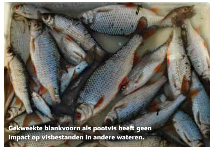
Gekweekte blankvoorn als pootvis heeft geen impact op visbestanden in andere wateren.

is wel bekend dat de uitzet van blankvoorn – of witvis in het algemeen – uit de rivieren meerdere nadelen heeft. Het wegvangen van witvis op de rivieren als pootvis heeft een negatief effect op de visstand in de rivier en dus ter plekke op de vangbaarheid. De vis wordt voor de hengel van de ene sportvisser weggevangen, om in ander water voor een andere sportvisser weer te worden uitgezet. Meerdere studies geven bovendien aan dat deze wildvang van stromend water niet goed gedijt in andere wateren. Lees verder op pagina 31.