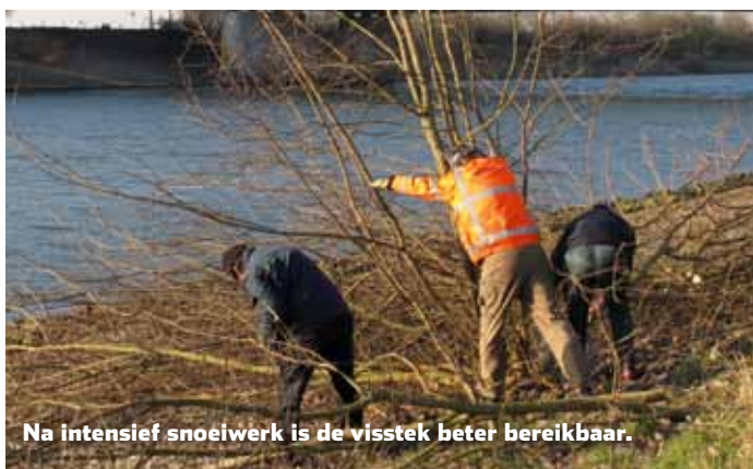
Na intensief snoeiwerk is de visstek beter bereikbaar.