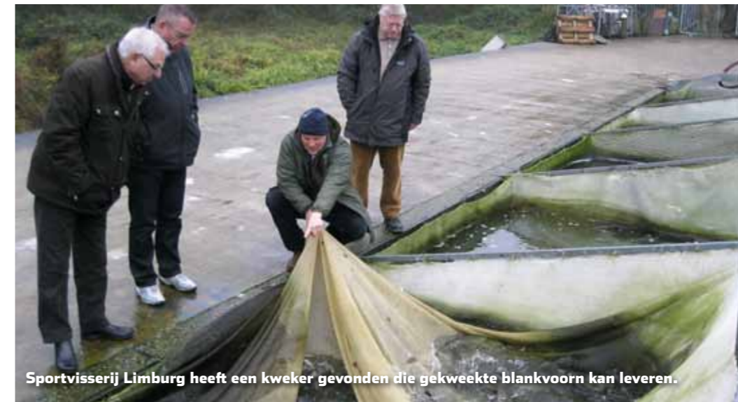
Sportvisserij Limburg heeft een kweker gevonden die gekweekte blankvoorn kan leveren.

Een sterftepercentage tot 80% van pootvis uit de rivier is geen uitzondering.