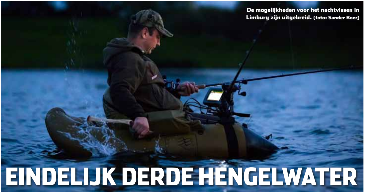
De mogelijkheden voor het nachtvisseren in Limburg zijn uitgebreid.