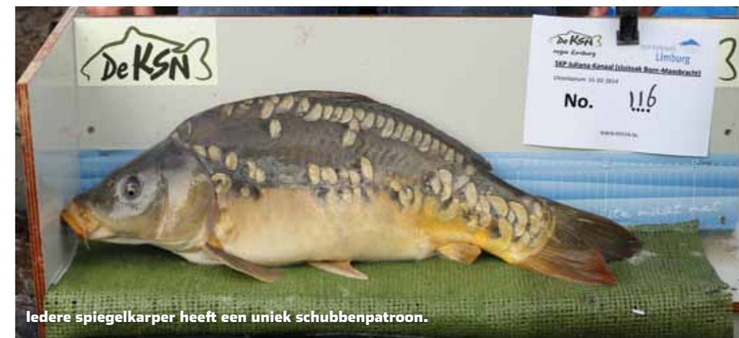
Iedere spiegelkarper heeft een uniek schubbenpatroon.