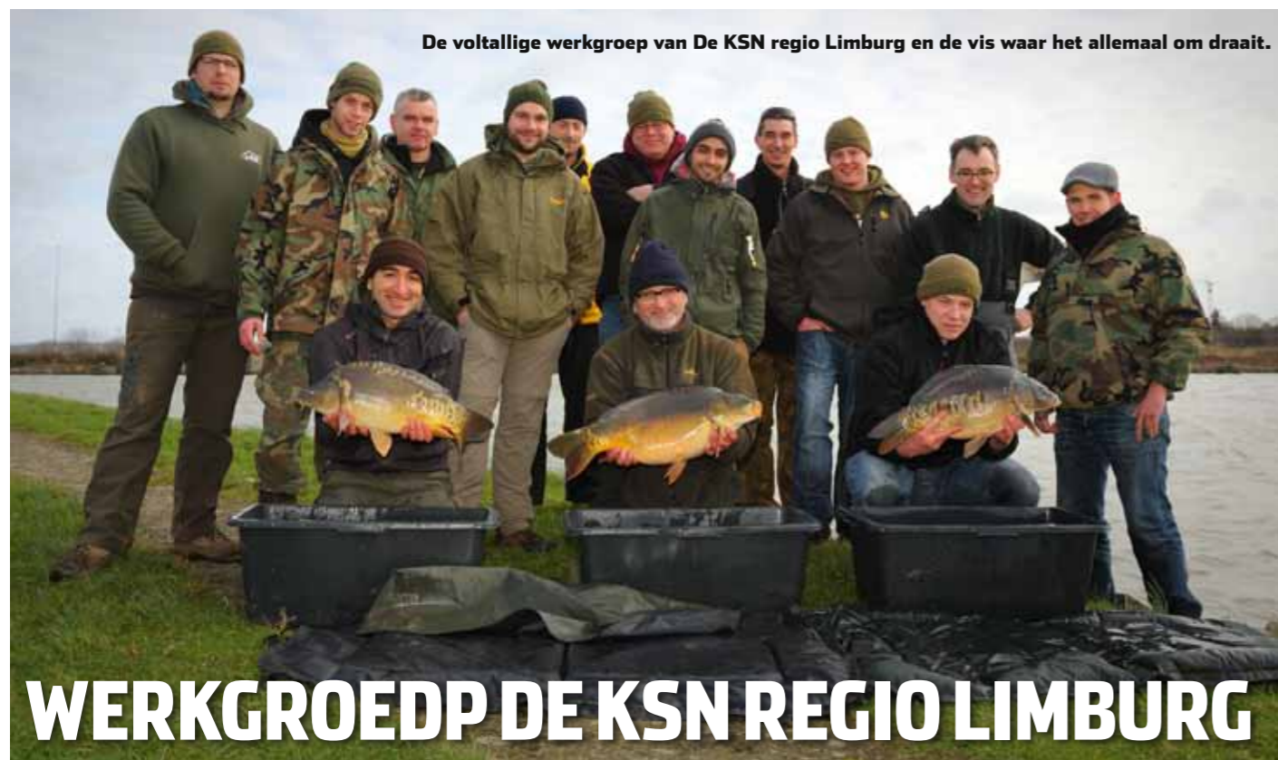
De voltallige werkgroep van De KSN regio Limburg en de vis waar het allemaal om draait.