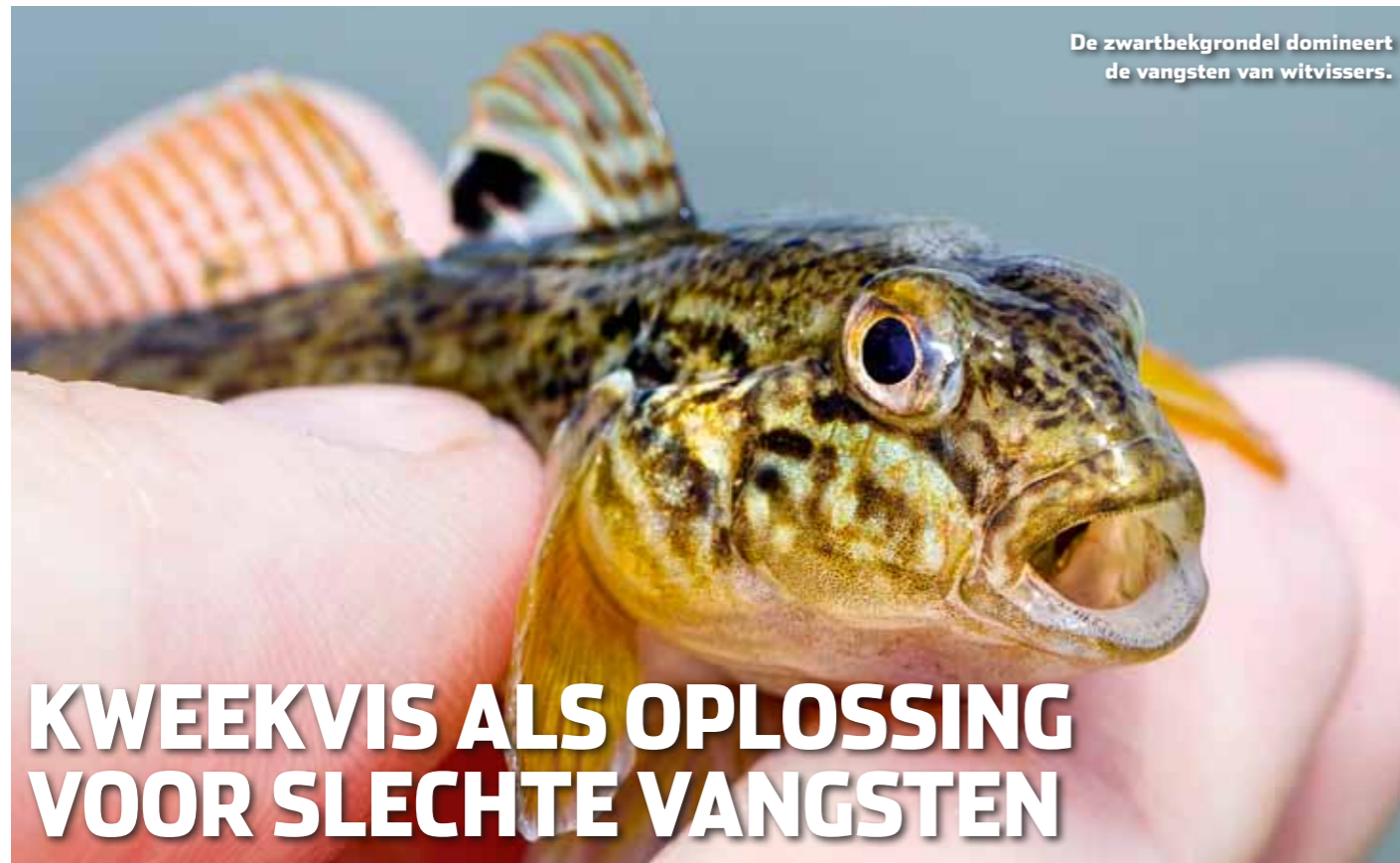
De zwartbekgrondel domineert de vangsten van witvissers.