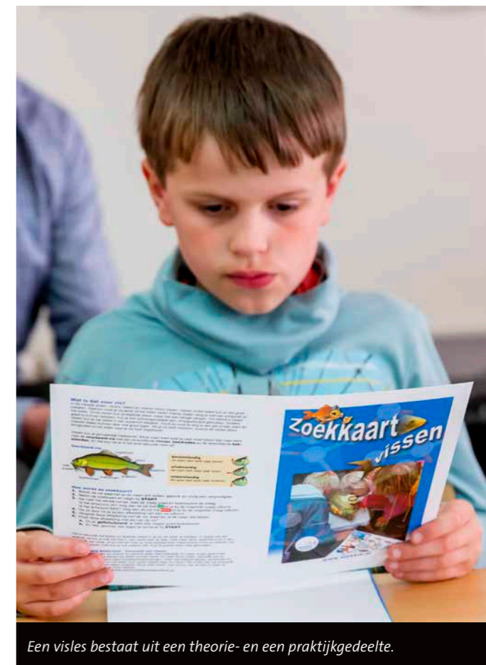
Een visles bestaat uit een theorie- en een praktijkgedeelte.

Daarbij zorgt de vergrijzing binnen de vereniging voor de extra uitdaging om vacatures binnen het bestuur gevuld te krijgen met jonge, enthousiaste sportvissers. Om er voor te zorgen dat de sportvisserij in Nederland een stabiele basis behoudt, is het nodig om te investeren in de jeugd. Je moet de jeugd al op jonge leeftijd enthousiast maken voor de hengelsport, anders ben je ze kwijt. Sportvisserij Limburg werkt hier actief aan mee, door het ondersteunen van jeugdprojecten die de hengelsport promoten bij de jeugd. Een van deze projecten is het 'Vissenschool' project. Dit project is gericht op basisscholieren van groep 7 en 8. Deze groepen krijgen dan een visles van een gecertificeerde vismeester.