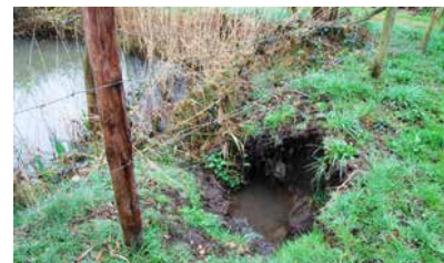
Op enkele verenigingswateren in Limburg huizen momenteel koppels bevers.

Sportvisserij Limburg zet ook sterk in op jeugd. Er wordt een uitgebreid activiteitenprogramma ontwikkeld dat moet leiden tot een toename van het aantal jeugdvissers. Binnen de wedstrijdvisserij wordt hier al op vooruitgelopen. Er loopt momenteel een uitgebreid programma met masterclasses. In 2017 wordt dit programma verder doorontwikkeld. Ook de opzet van de federatiewedstrijden wordt in een nieuw jasje gestoken. In samenwerking met de Projectgroep Wedstrijden wordt er een nieuwe weg ingeslagen om het wedstrijdvisen op federatief niveau een impuls te geven.