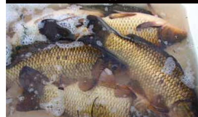
'Aalscholverproof' karpertjes uitzetten in visvijvers vormt een van de speerpunten.