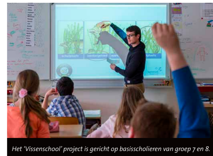
Het 'Vissenschool' project is gericht op basisscholieren van groep 7 en 8.

De zonnebaars is een visje dat vanuit vijvers en aquaria in het openbare Nederlandse water is beland. Dit is een prachtig visje om te zien, maar niet geheel onschuldig aangezien hij broed van andere vissen opeet. Deze vis werd ook veelvuldig gevangen en zijn uiterlijk sprak de leerlingen vanzelfsprekend bijzonder aan. Wederom een leuke vis voor de jeugd dus, maar het blijft wel een exoot die wij liever niet in onze wateren tegenkomen. Al met al hebben wij via het 'Vissenschool' project dit jaar weer veel jeugd enthousiast gemaakt voor sportvissen. Wij willen dit uiterst succesvolle programma de komende jaren dan ook verder uitwerken.